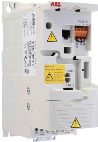
ABB Inverter Drive, 0.75 kW, 3 Phase, 400 V ac, 2.4 A, ACS355 Series