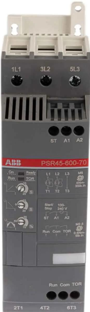
ABB Soft Starter, Soft Start, 22 kW, 600 V ac, 3 Phase, IP10, IP20